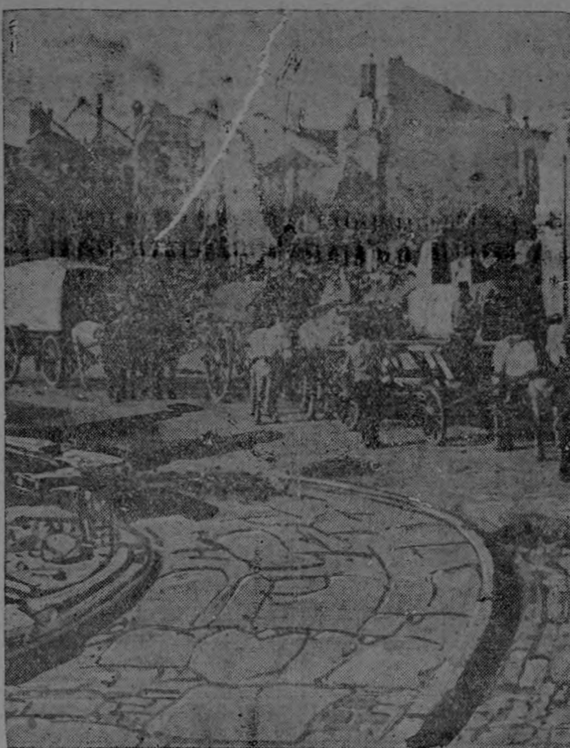
This cut shows a scene in Bacarat, a village in eastern France which was destroyed in the course of violent fighting.